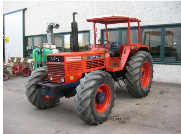
Figura 9: Trattore inviato alla farm di Gulu all'inizio del 2012

Per i beneficiari del programma è previsto l'organizzazione del corso di allevamento avicolo per la produzione razionale di uova su piccola scala. A tal proposito si renderanno necessarie alcuni semplici lavori di adeguamento della struttura predisposta per accogliere gli animali e l'acquisto dell'attrezzatura utile per l'avvio di questa attività. Inoltre un'altra iniziativa in favore dei beneficiari sarà l'avvio di un breve corso di water & sanitation per fornire le conoscenze necessarie ed indispensabili per una corretta gestione dell'acqua nella vita quotidiana familiare. A tale proposito si vuole coinvolgere una ONG locale o internazionale con esperienza in questo settore. Per quanto riguarda la Farm, un aspetto molto importante sarà una attenta gestione dei prodotti agricoli ottenuti nella precedente stagione in modo da ottenere un primo significativo profitto dalle vendite.