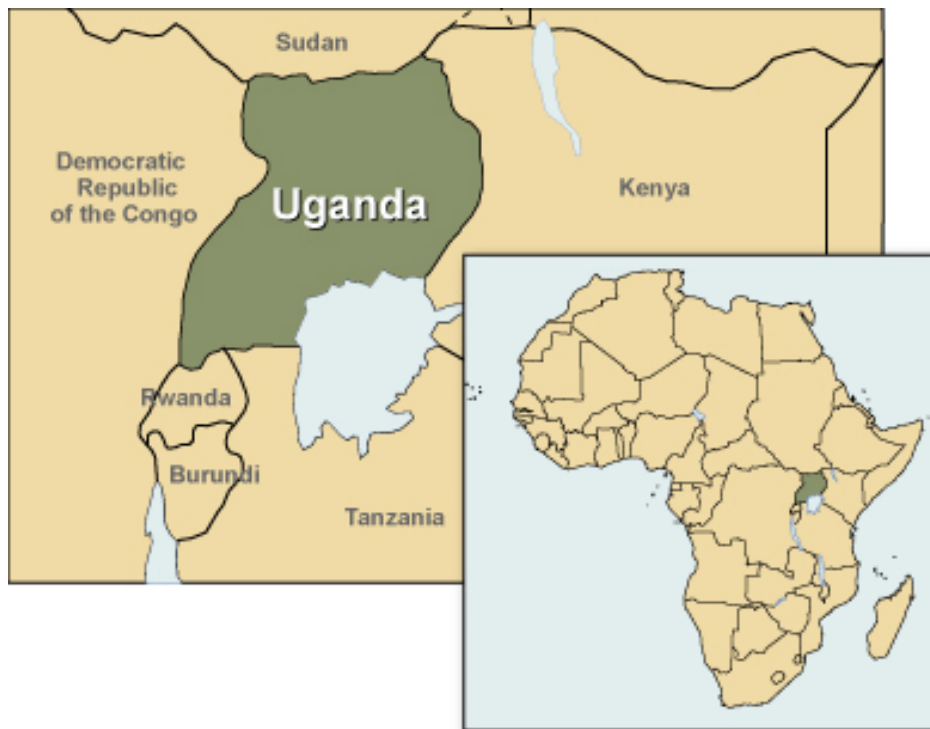
Figura 10: Posizione dell'Uganda nel continente africano