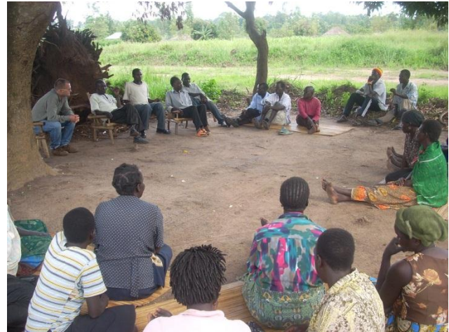
Figura 5: Incontro della comunità

Un dato spaventoso ed emblematico: secondo una fonte Unicef (dati dicembre 2007) più di 25.000 bambini sono stati rapiti dai ribelli dal 1986. Nonostante tutto questo, questa generazione cresciuta nei campi sfollati ha dimostrato una capacità di resilienza alle sfide imposte dal conflitto insperata: tale capacità rappresenta la speranza che essa possa contribuire in maniera decisiva alla ricostruzione del tessuto sociale della regione. La valorizzazione della creatività e dell'identità' dei