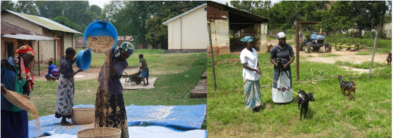
Figura 8: Lavorazione del frumento raccolto e consegna delle capre ai beneficiari

Le condizioni sanitarie dei bovini e dei caprini della Farm sono buone. Essi vengono regolarmente trattati con specifici prodotti veterinari da parte dei lavoratori. Nell'ambito dell'attuazione del programma di miglioramento genetico dei caprini, è stato acquistato presso un'azienda zootecnica di Masaka un becco di razza pura al 100% South African Boer, una razza migliorata sudafricana ben adattata ai climi tropicali e apprezzata per l'elevata resa in carne. Il becco verrà mantenuto in azienda e verrà utilizzato per incrociarsi con le capre indigene della Farm e quelle distribuite ai beneficiari stessi, perfezionando così il programma di distribuzione delle capre già in atto attraverso il sistema del revolving fund.