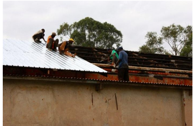
Figura 6: Costruzione di un ricovero temporaneo e ristrutturazione di un capannone

La scelta delle colture è stata discussa con lo staff della Farm e valutata sulla base dei risultati ottenuti nella stagione precedente, dei costi e delle richieste di mercato.