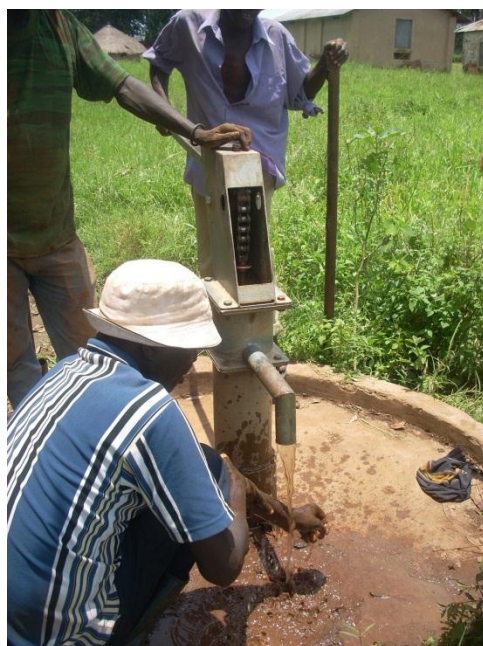
Figura 7: Installazione di una pompa per l'acqua

Per la soya si è deciso di cambiare varietà rispetto a quella utilizzata nella stagione precedente, scegliendone una a ciclo più breve. La germinabilità dei semi è stata testata ed è risultata buona.