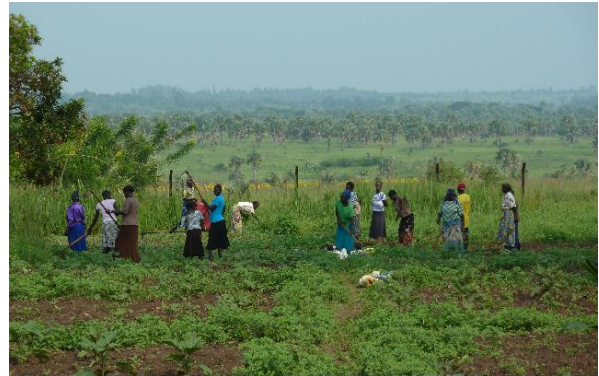
Figura 1: Donne al lavoro nella farm di Gulu

L’esperienza del “campo solidale” è un momento di formazione alla solidarietà adatto a tutti coloro che desiderano approfondire le tematiche del volontariato internazionale e svolgere una prima e