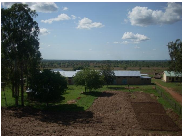
Figura 4: vista aerea della farm di Gulu

Il Nord Uganda, a causa del conflitto ventennale interno che l'ha stravolto, è ora in situazione di pesante svantaggio rispetto al resto del paese che, al contrario, negli ultimi anni ha raggiunto significativi risultati sia in termini economici che di riduzione della povertà. La mancanza di sicurezza nella regione ha sconvolto la vita della maggior parte della popolazione che è stata costretta a rifugiarsi nei vari campi profughi, impedendogli di lavorare nell'agricoltura o in altri