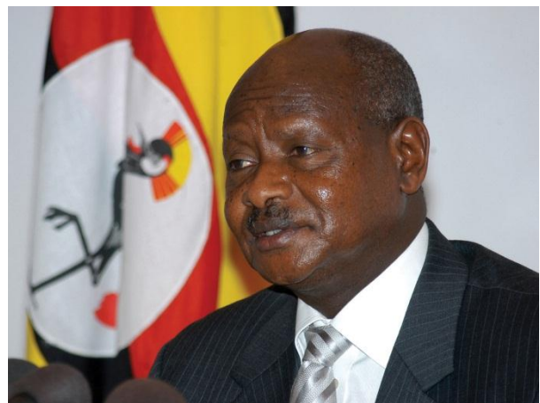
Figura 11: Yoweri Museveni, presidente dell'Uganda dal 1986 ad oggi

Con Museveni, un ribelle di ispirazione marxista che ben presto si avvicinò agli Stati Uniti, l'Uganda ha conosciuto un periodo di stabilità e di crescita. Tuttavia, come si è sottolineato sopra, le contraddizioni non mancano. Le disuguaglianze storiche interne al paese non si sono affievolite e dal 1986 la regione settentrionale, una delle più povere del paese, ha conosciuto una guerra disastrosa. Con l'ascesa di Museveni, gli Acholi, che sin dall'epoca coloniale erano stati impiegati come militari, vennero cacciati dall'esercito. Il ritorno nelle regioni settentrionali di migliaia di